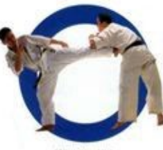
横蹴り Side Kick