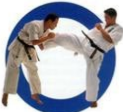
前蹴り Front Kick