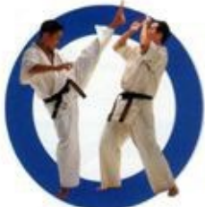
踵落とし蹴り Axe Kick