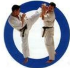
上段蹴り High Roundhouse Kick