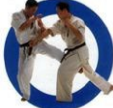
下段蹴り Low Kick