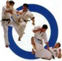
足掛けから同時に下段突き Leg Sweep Followed By A Strike