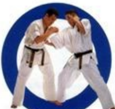
下突き Lower Thrust