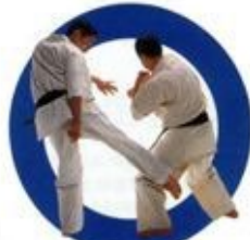
下段蹴り Low Kick