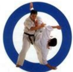
回転し蹴り Roll Kick