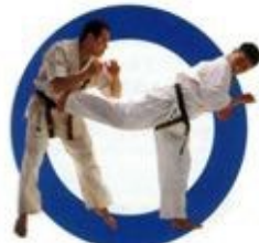
後ろ蹴り Back Kick