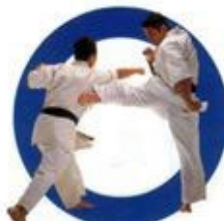
中段蹴り Middle Roundhouse Kick