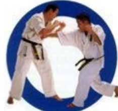
正拳突き Fore-Fist Thrust