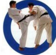
膝蹴り Knee Kick