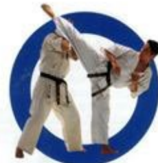
後ろ廻し蹴り Spinning Back Kick