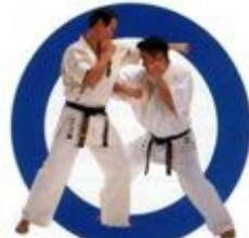
肘打ち Elbow Strike